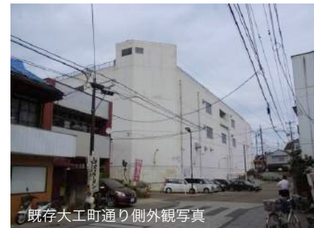
既存大工町通り側外観写真