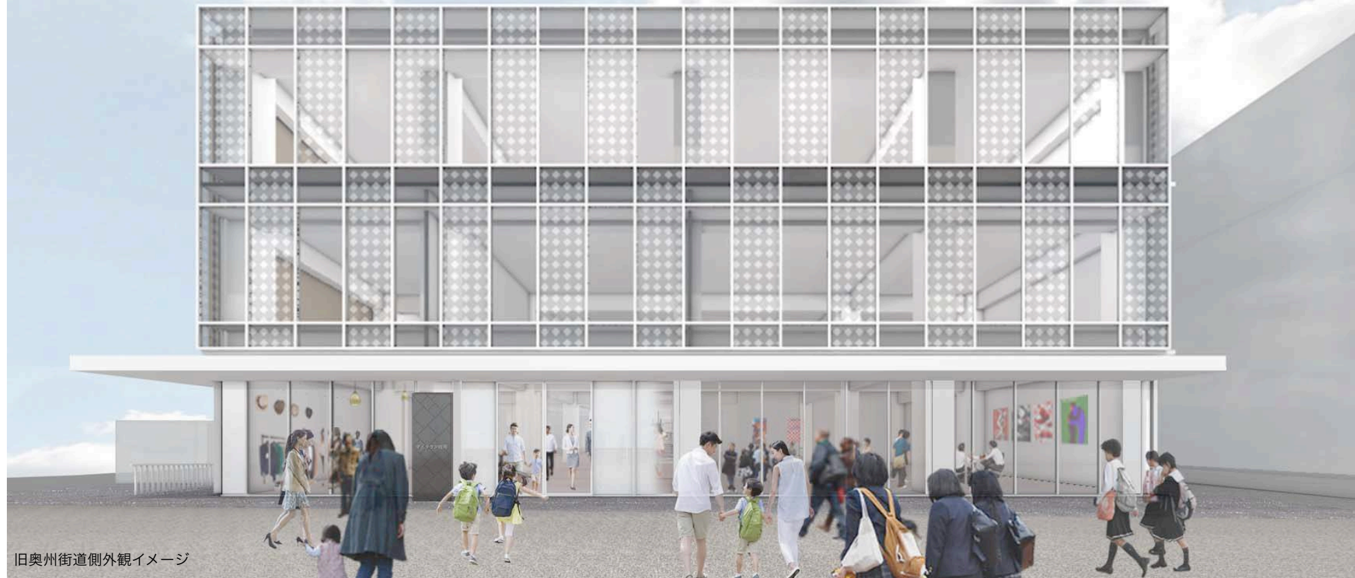
旧奥州街道側外観イメージ