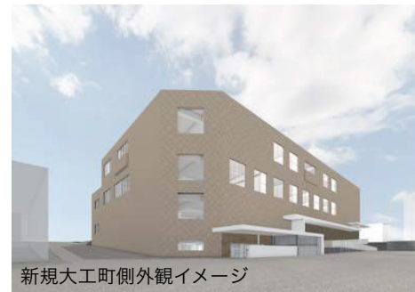
新規大工町側外観イメージ