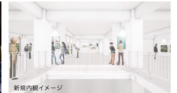
新規内観イメージ

この度、お施主様のご厚意により解体見学会を開催することになりましたので、ご案内いたします。