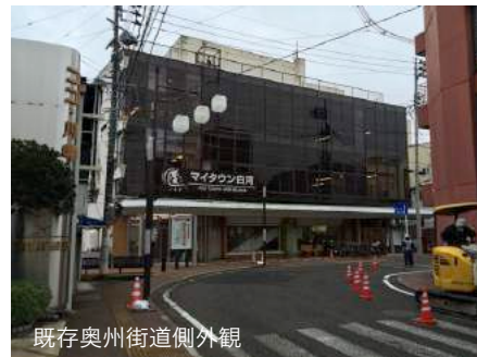
既存奥州街道側外観