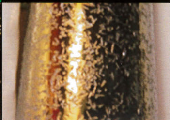
④ 結晶析出調陰陽点