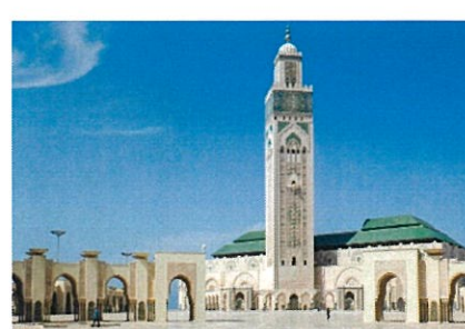
ハッサン2世モスク (カサブランカ)