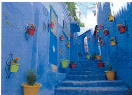
青い街・シャウエン

サハラ砂漠（シェビ大砂丘）の入口にある「メルズーガ大砂丘」を訪れます。先住民ベルベル人の移動式住居を見学して遊牧民の生活に触れます。キャメルトレッキングも体験いただきます。夜は満点の星空を朝は真っ赤に染まる砂漠の大地をご堪能ください。