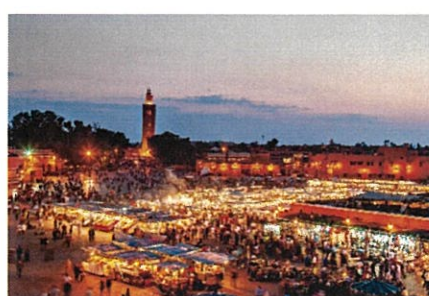
世界遺産マラケシュ旧市街の街並み