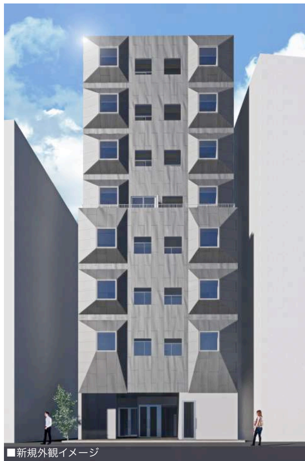
■新規外観イメージ